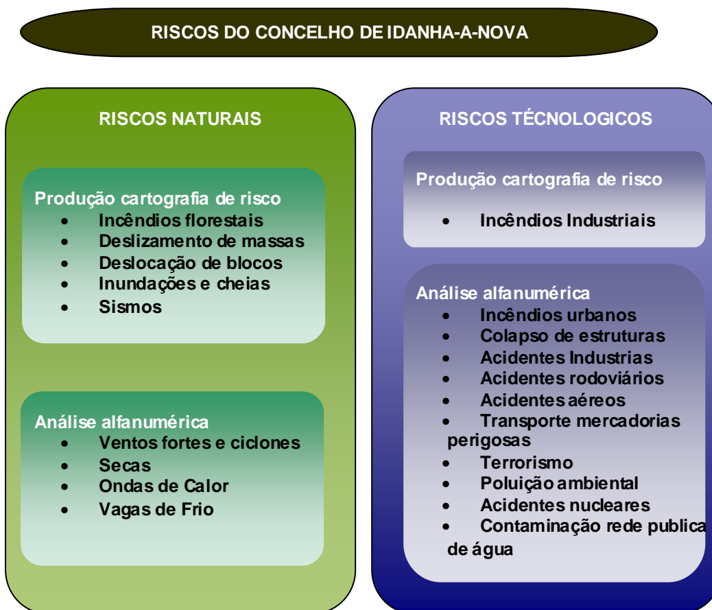
Figura: 1 Riscos de Origem natural e tecnológica analisados no PMEPCIDN.

Na figura I encontram-se identificados os riscos naturais e tecnológicos, que poderão ocorrer no concelho, sendo analisados como já referido anteriormente no (Ponto 5 da secção II- Parte IV).